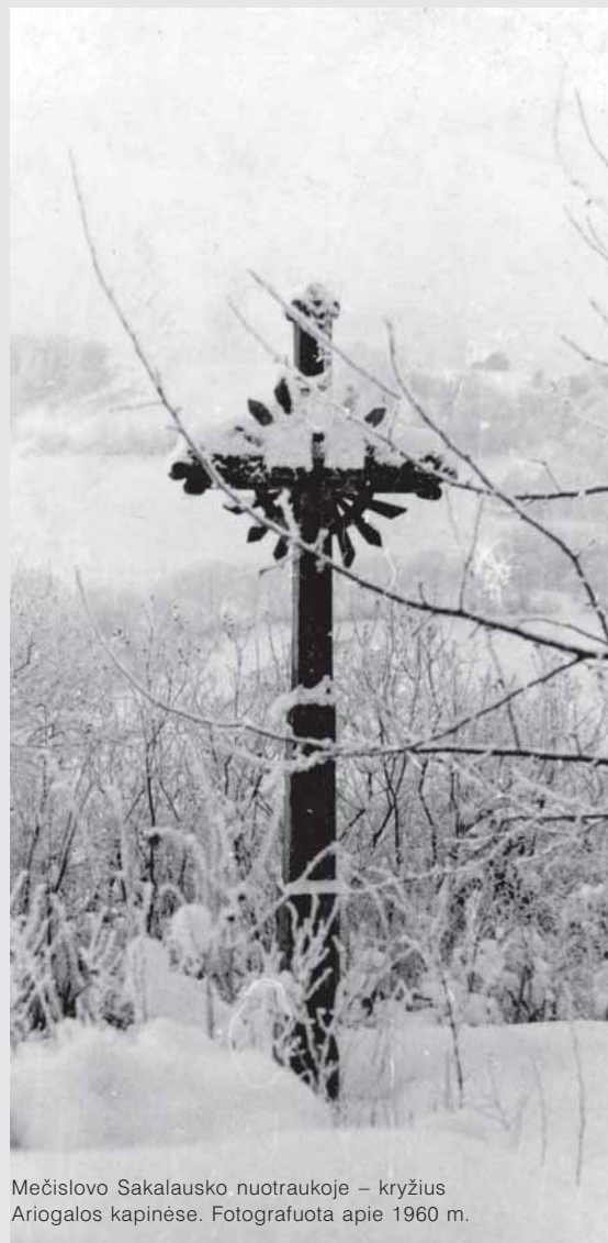
Mečislavo Sakalausko nuotraukoje – kryžius Ariogalos kapinėse. Fotografuota apie 1960 m.