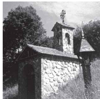
Nuotraukose (iš kairės): Mūro kryžius Ariogaloje, paminklas Chlevinskiui Ariogalos kapinėse (abi nuotraukos darytos 1936 m., saugomos Kultūros paveldo centro archyve); Daugirdų šeimos koplyčia Ariogalos kapinėse. M. Sakalausko nuotrauka, 1991 m.; A. Čikaitės-Rusinienės suprojektuota koplytėlė Lietuvos partizanams Ariogalos apylinkėse. J. Danausko nuotrauka iš Raseinių krašto istorijos muziejaus rinkinių

➤ 1884 m. Ariogaloje įsteigta evangelikų liuteronų parapija. ➤ 1885 m. Ariogaloje pastatyta evangelikų liuteronų bažnyčia. ➤ 1878 m. Ariogaloje įsteigta berniukų mokykla. ➤ 1880 m. Ariogaloje pradėjo veikti paštas. ➤ 1897 m. Ariogaloje buvo 2 376 gyventojai. ➤ 1907 m. Ariogaloje įsteigtos berniukų ir mergaičių mokyklos. ➤ 1908 m. „Saulės“ draugija Ariogaloje įsteigė lietuvišką mokyklą. 1933 m. ją lankė 185 mokiniai.